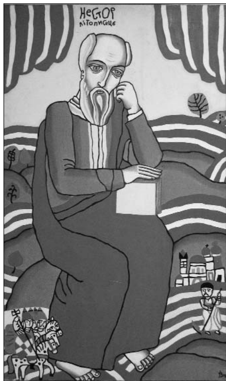
Літописець Нестор. 1984

За життя Задоржний встиг створити й низку талановитих парсун історичних постатей: Аттіли, Аліпія, Ярослава Мудрого, Максима Березовського, Юрія Кондратюка тощо. У задумах були Ліна Костенко й Тарас Шевченко, Гальшка Гулевичівна й ілюстрації до “Кобзаря” і ще багато іншого. Але здійснити й невеликої частки задуманого йому вже не судилося — 1988 року відлетів він у вищі світи. Наскільки грандіозними були задуми Івана-Валентина Задоржнього, наскільки глибоко проникнув він у пам'ять тисячоліть і психологію рідного народу можна зрозуміти з тої невеликої, з огляду всього його творчого доробку, виставки в галереї ім. Замостян Києво-Могилянської академії. Хоча організатори намагалися представити насамперед монументалістику (в картинах, ескізах, фотокопіях), але численні полотна стали органічним доповненням їхнього задуму. Задуму — показати велику любов художника до Жінки, своїх земляків-українців, до загадкової і величної історії України.