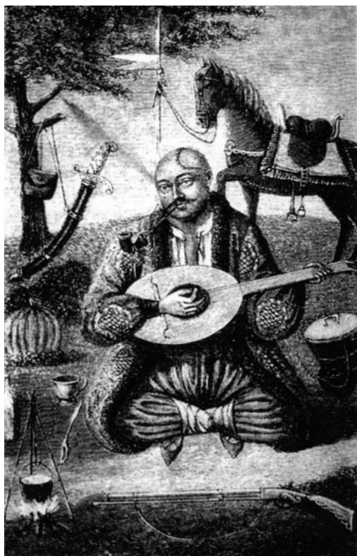
Картина «Гайдамака». Кін. XVIII ст. Из зібрання Я.Новицького; за книгою Д.І. Яворницького «Запорожье в остатках старины и предания народа» (1888)

що картини з написом «Козак Мамай» включають сцени гайдамацької розправи» [4, с.7].