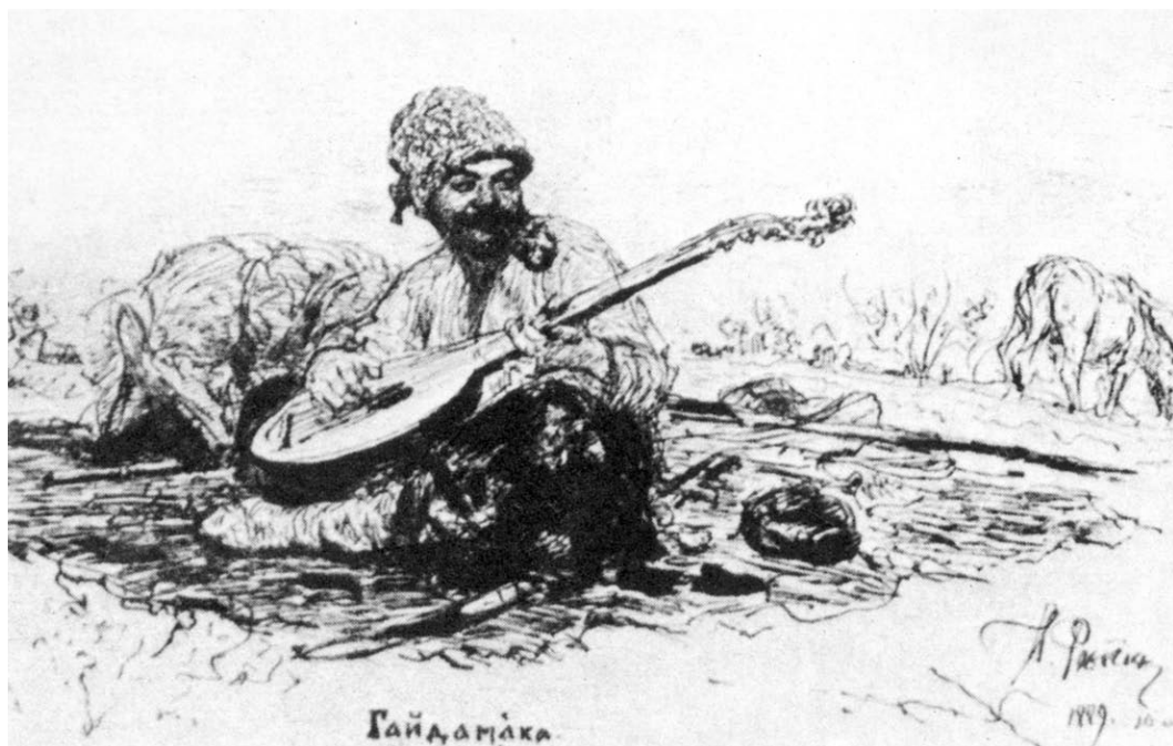
Ілля Рєпін. Гайдамака. Офорт. 1889

птурами та картинами, що належать до кола буддійської релігії. Саме в такій (або близькій) сидячій позі, як у Мамає, зображували (і зображують) Будду, бодхісатв та інших божеств буддійського (а подекуди також й індуїстського) пантеону. Це стосується, наприклад, численних скульптурних творів видатного монгольського скульптора релігійного діяча XVII ст. лами Дзанабадзара [34, с. 82–83]. У такій самій східній позі монгольські художники зображували на папері, полотні та шовку не лише божеств, а й своїх героїв (наприклад – Абатай-хана) [34, рис. 48].