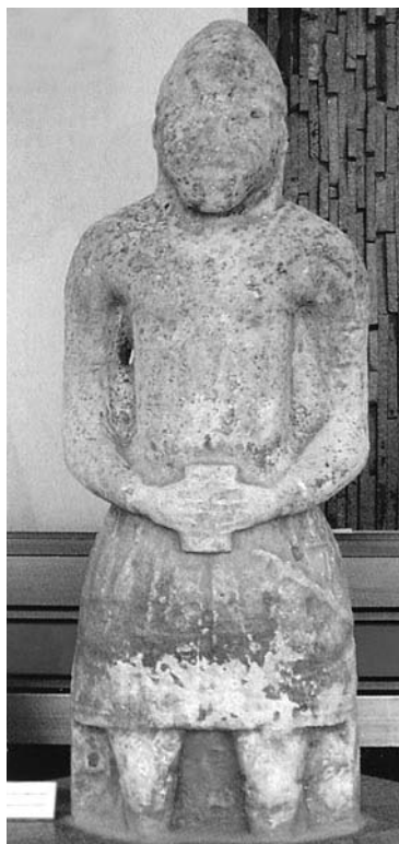
Чоловіча статуя. Вапняк. XII-XIII ст. Хортиця

Знаменитим, унаслідок заперклогої Сталінградської битви часів Другої світової війни, є «Ма-