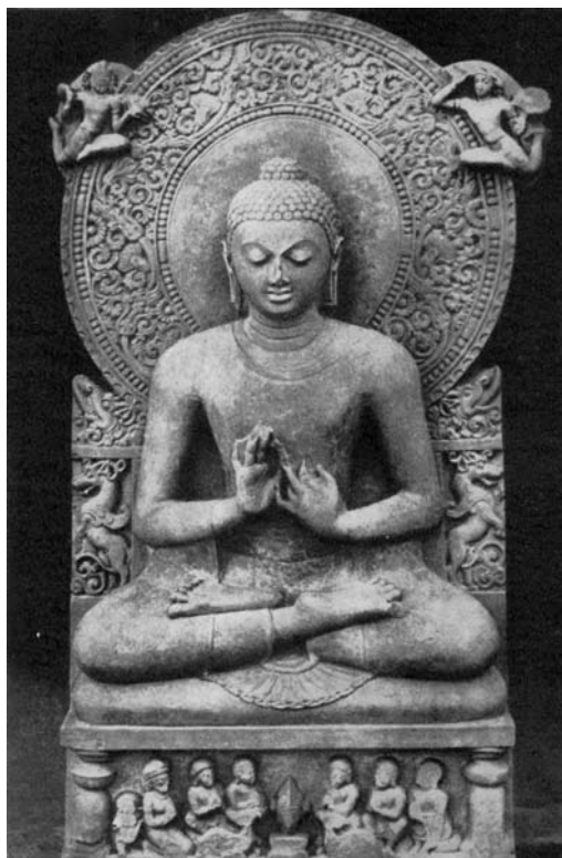
Невідомий скульптор. Будда в медитації. Пісковик. V ст. Індія.

При цьому лише на одному творі є напис "Козак Мамай", на трьох інших ім'я героя не вказано, а ще на двох картинах є назви «Запорожский кошевой» та «Хома» («А имя мини Хома») [17].