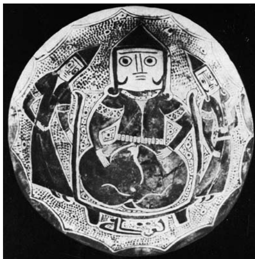
Невідомий майстер. Стилізована постать правителя у «східній» позі. Таріль. VII ст. Іран