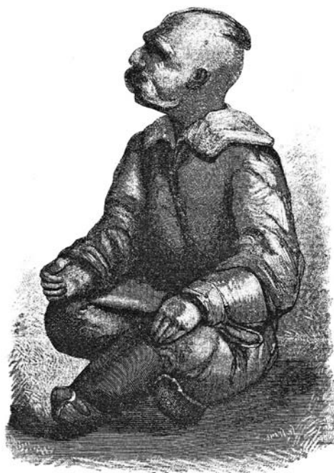
Скульптурний образ запорожця.

Хоча при цьому можна знайти композиційні паралелі українських народних картин мистецтві Індії, Тибету, Китаю та інших народів Далекого Сходу, особливо з бронзовими скульп-