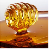
Вода с медом натошак: польза и особенности применения