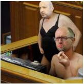
Українська політика-2016. Сміх крізь сльози....