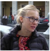
Чи боїтесь ви втратити Путіна? – опитування росіян...