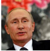
«У Путіна зараз великі проблеми і це дуже серйозно»