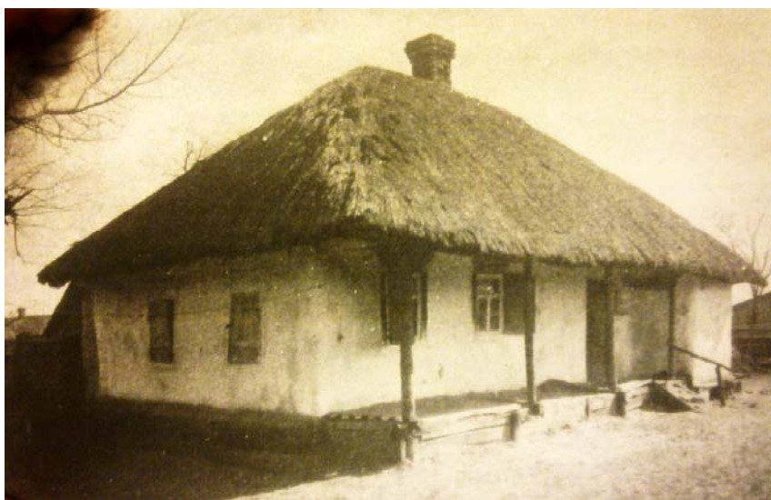
Рис.2 Традиційна хата. м.Харків, вул. Кладбищенська, 15. поч. ХХст.

Якщо повернутися до пропорцій та закономірностей, що їх зазначив у своїх дослідженнях С.Таранушенко, можна зробити те, на чому він не спинявся -